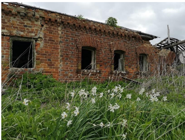
Рис. 1. Место обнаружения документа: полуразрушенный дом в нежилой д. Судово Тульской области